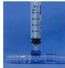
ニードルフリー サンプルポート